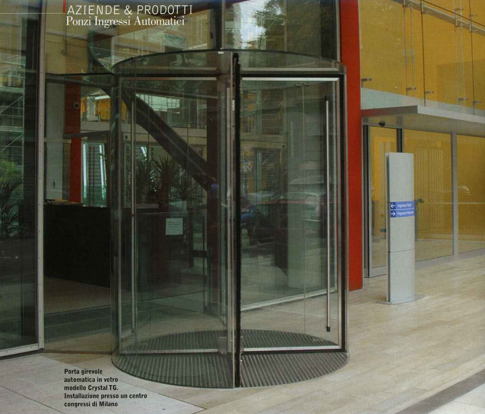
Porta girevole automatica in vetro modello Crystal TG. Installazione presso un centro congressi di Milano

realizzato porte girevoli che contengono porte scorrevoli al loro interno; abbiamo in produzione qualsiasi tipo di porta scorrevole, lineare o curva.