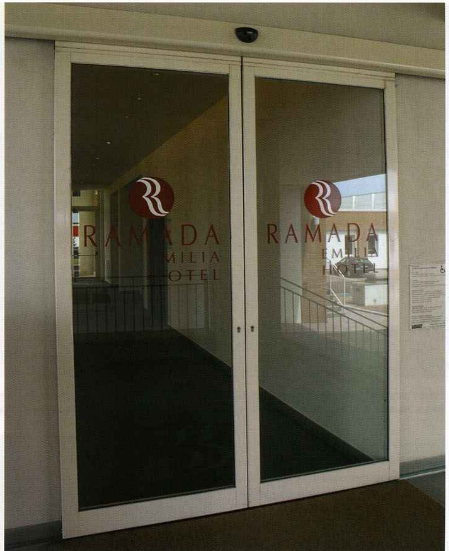
Porta scorrevole automatica Ponzi TOS installata presso l'Hotel Ramada di Reggio Emilia. Sotto, lo Starhotel Tuscany di Monginevro (FI): vetrata e ingresso automatico girevole sono firmati Ponzi

"No. È semmai vero il contrario. L'ingresso automatico valorizza il grande come il piccolo hotel, l'albergo storico come la struttura dal design più futuribile, l'albergo di categoria 2 e 3 stelle come quello d'affari di categoria superiore o il relais di