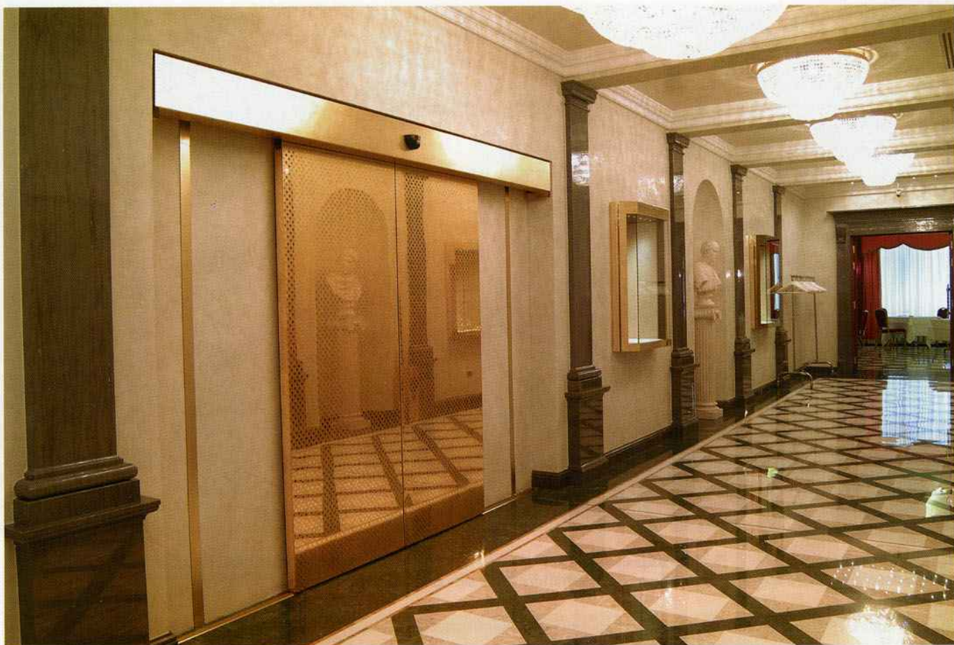
Porta automatica scorrevole Ponzi di compartimentazione interna, con particolare e preziosa finitura in foglia d'oro, installata all'Hotel Carlton di Bologna