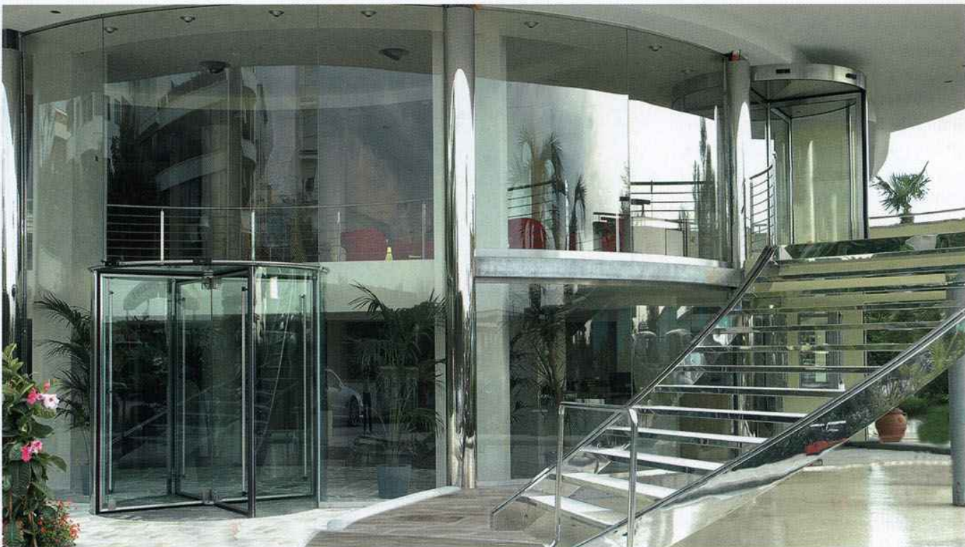
L'Hotel Waldorf di Milano Marittima (RA): porta girevole automatica Ponzi Crystal e, al primo piano, porta girevole Ponzi Tourniket con finiture in acciaio inox satinato. Le facciate sono firmate Ponzi, con il particolare sistema a ragno. Sotto, lo zerbino tecnico Ponzi Entrada ad alto potere assorbente e pulente

lusso. A Roma abbiamo fornito le porte girevoli al Marriott Park Hotel, il più grande albergo congressuale di lusso d'Europa, con le sue 600 camere e un centro congressi capace di ospitare circa 7000 persone. Al Marriott vi saranno tre ingressi girevoli di 3,80 metri di diametro, a tre ante, di grande impatto scenografico, analoghe a quelle che abbiamo installato in alcuni centri commerciali, in grado di garantire l'entrata e l'uscita rapida di un gran numero di persone.