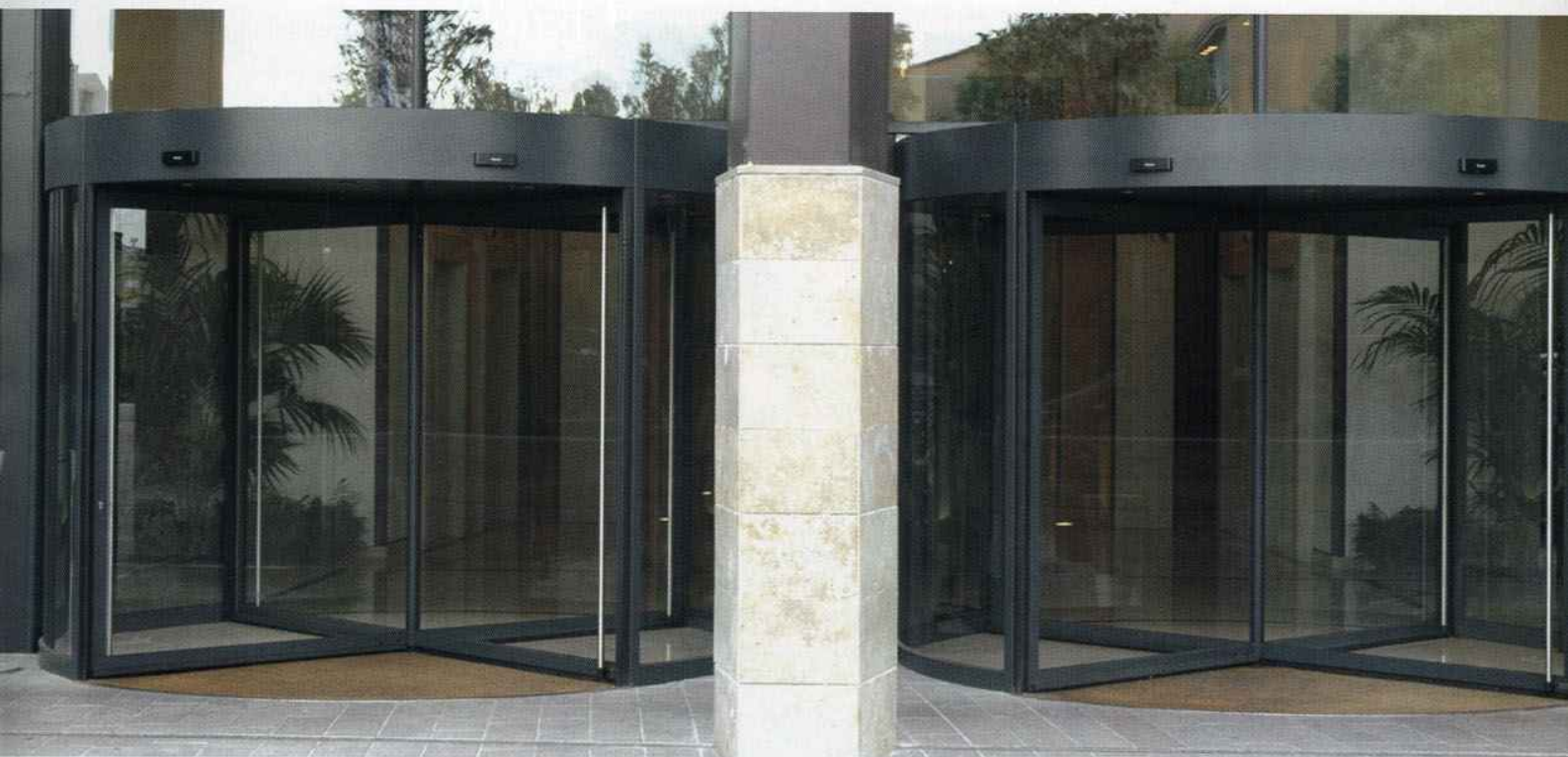
All'Hotel Metropole di Firenze sono state installate due porte girevoli Ponzi TQ del diametro di 3,8 metri. Sotto, porta automatica girevole a due ante modello Duotour, rotante e scorrevole, installata presso una struttura di una nota catena alberghiera, Novotel

anche le due porte girevoli e la facciata in tutto vetro con elementi strutturali a ragno in acciaio inox.”